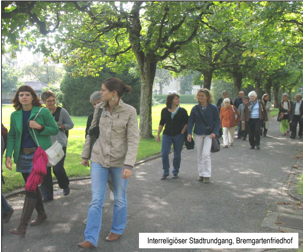
Interreligiöser Stadtrundgang, Bremgartenfriedhof

schiedlicher Religionszugehörigkeit durchmischte Gesprächsbeteiligung. Die Beiträge waren alle sehr gut vorbereitet und eröffneten einen wichtigen Einblick in das jeweilige religiöse Grundverständnis. Bei aller Unterschiedlichkeit waren auch die Übereinstimmungen verblüffend. Es gibt keine Verherrlichung von Armut oder Reichtum in den Religionen. Arme und reiche Menschen sind aufeinander bezogen, stehen beide Gott oder der ethischen Überzeugung gegenüber und haben sich von daher zu bewähren. Alle Religionen kennen sehr radikale, sozialkritische Ansätze im Zusammenhang mit unlauter erworbenem oder egoistisch bewahrtem Reichtum; um Not abzuwenden geht es in der Regel um konkretes, aktuelles, unmittelbares Handeln.