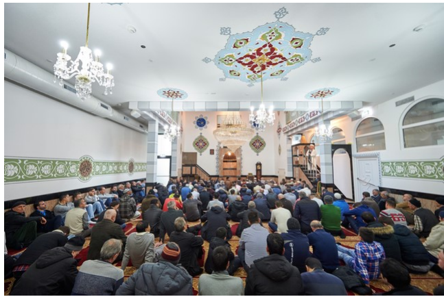
Der Stadtrat hat den Leistungsvertrag mit dem Haus der Religionen genehmigt.

Der Berner Stadtrat hat an seiner Sitzung vom Donnerstagabend den Leistungsvertrag mit dem Verein «Haus der Religionen - Dialog der Kulturen» genehmigt.