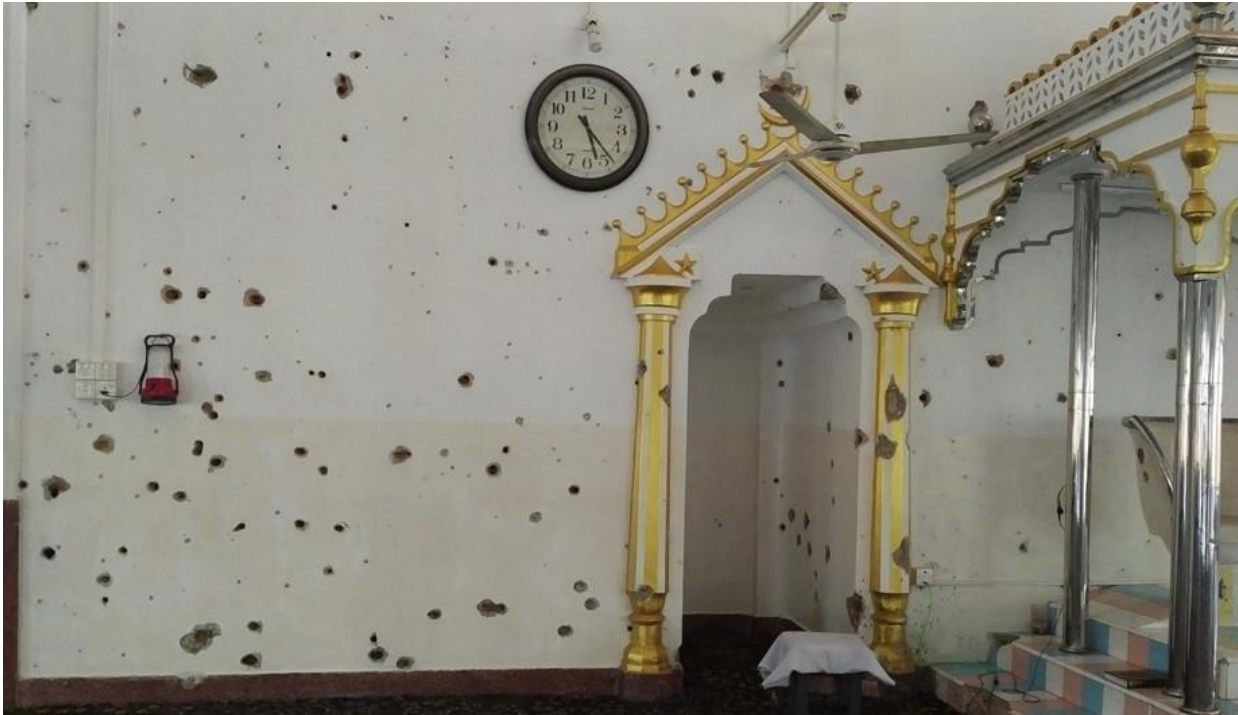
Bild: Kattankudy Mosque